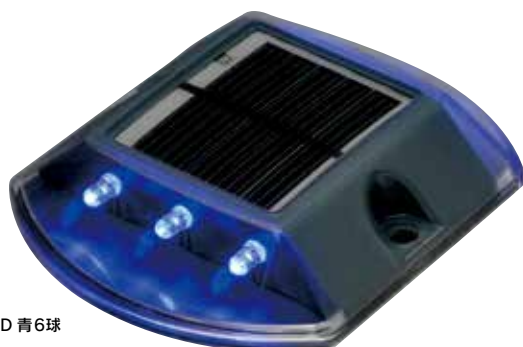
SZY-B 両面発光LED 青6球