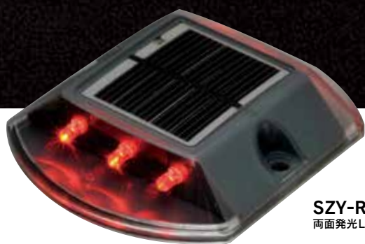
SZY-R 両面発光LED 赤6球