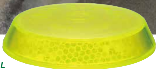
R-2-L-L 全周反射 オールライム