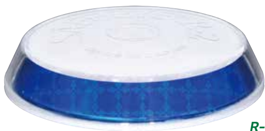
R-2-B 全周反射 青